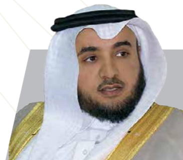
م.سعود بن راشد العسكر الهيئة السعودية للمواصفات والمقاييس والجودة