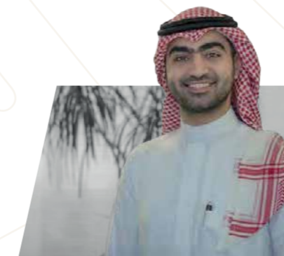
أ.عبدالله بن عبدالعزيز العوده وزارة التجارة