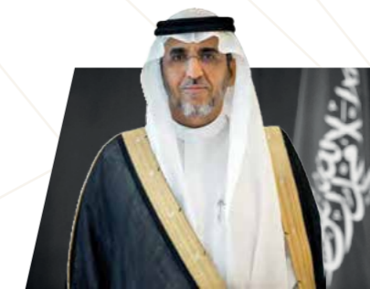
د.سعود بن عثمان القصبي اللجنة الوطنية لكود البناء السعودي